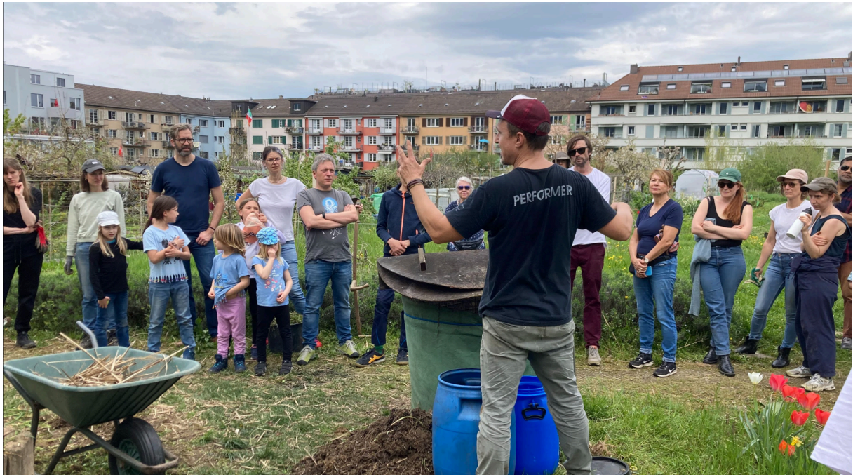
Gemeinsamer Aktionstag am 8. Juni 2023