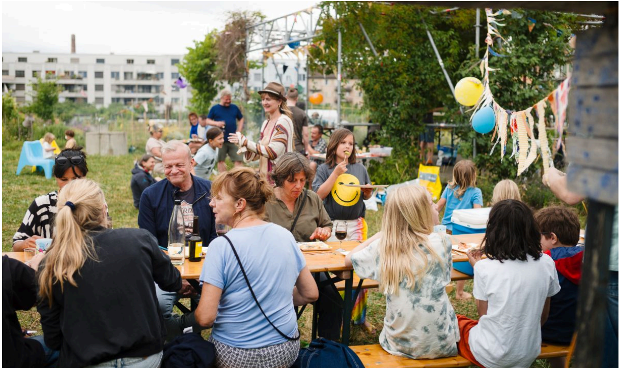
Jubiläumsfest 1. Juli 2023

Der Vorstand hat sich entschieden, bei der Organisation des Jubiläumsfests keine leitende Rolle einzunehmen. Das Fest sollte ganz im Sinne des Gemeinschaftsgartens von den Mitgliedern gestaltet werden, was dann auch gelungen ist. Viele Mitglieder haben in ganz unterschiedlicher Weise zum Fest beigetragen, so dass die Vielfalt unseres Gartens bestens zum Ausdruck gekommen ist. Ein grosses Dankeschön an alle, die mitgeholfen haben!