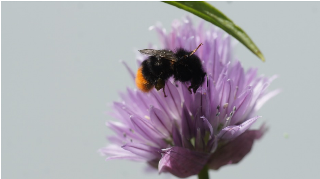
Steinhummel ( Bombus lapidarius ruderarius )

Wildbienen sind in Gärten enorm nützlich. Nicht zuletzt verbessern sie den Ernteertrag, denn sie bestäuben die Kulturen und Obstbäume sehr effizient und fliegen auch bei kühleren Temperaturen und regnerischem Wetter. Hummeln beispielsweise sind sehr gute Bestäuber von Tomaten.