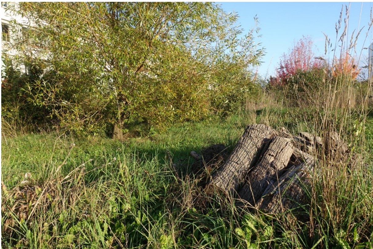
Haufen mit Totholz im Naturgarten, der in das Wildbienenbiotop integriert werden würde.

Auf den folgenden Seiten erläutern wir das Ziel und den Umfang des Projekts. Grün Stadt Zürich unterstützt das Projekt. Da der Entscheid über die Art der Unterstützung durch GSZ erst nach der MV 2024 erfolgen wird, beantragen wir das Budget gemäss der eingeholten Offerte vom Gärtner.